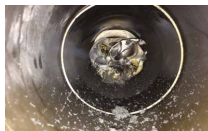
Manchon fermé côté pièce