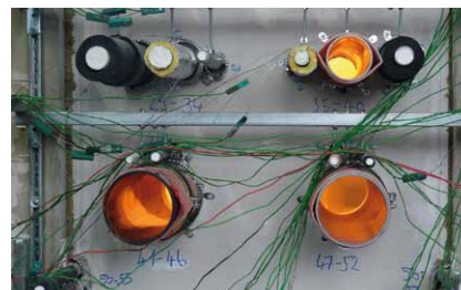
Essai selon EN1366-3

Les isolations de conduite en polyéthylène, non-tissé en polyester, mousse élastomère à alvéoles fermées (caoutchoucsynthétique) et laine minérale doublée alu peuvent être placées localement « LS » et en continu « CS ». Pour des parois massives à partir d'une épaisseur de mur de 100 mm, cloisons de séparation en placoplâtre des deux côtés, plafonds à partir de 150 mm et systèmes d'obturation souples à partir de 100 mm dans les parois et les plafonds. Jusqu'à DN110, ils peuvent également être utilisés dans des cloisons de gaine en placoplâtre recouvertes d'un côté (revêtements possibles 2x20 mm GKF, 2x25 mm GKF, 3x15 mm GKF). Le manchon coupe-feu se compose d'un boîtier en tôle d'acier inoxydable avec des enduits isolants posés. Testé conformément à ÖNORM EN1366-3, EI90/EI120 classifié selon ÖNORM EN13501-2 et homologué conformément à ETA 13/0758.