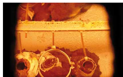
Manchon expansé dans le local incendie